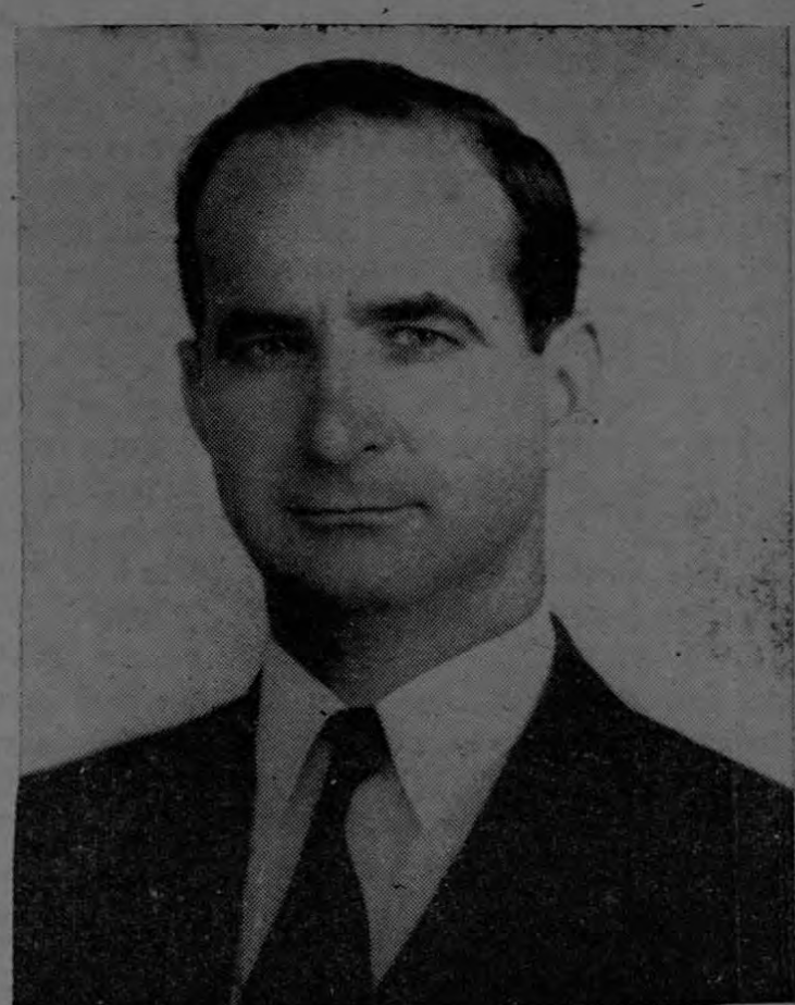
DON JOSE FIGUERES FERRER Quien asume el mando de la república por 18 meses, a quien le presentamos un atento saludo en unión de su Ejército de Liberación Nacional.